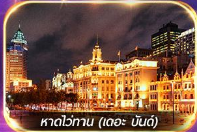
หาดวอگان (เดอะ บันด์)

เที่ยวดิสนีย์แลนด์เต็มวัน (รวมรถรับ-ส่ง)