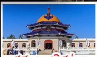
สุสานเจกิสข่าน