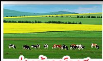
ทุ่งหญ้าเออร์ดอส

ทุ่งหญ้าเออร์ดอส สุสานเจกิสข่าน แกรนด์แคนยอนแม่น้ำเหลือง