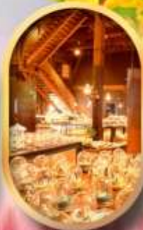
พิพิธภัณฑ์ถ้ำลอดดนตรี