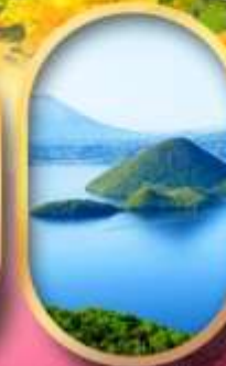
วิวทะเลสาบโทโยะ