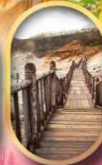
หุบเขาจิทอกุคาบิ