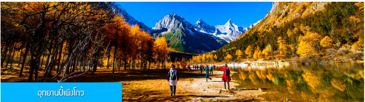
อุทยานเป่ย์เฟิงโกว