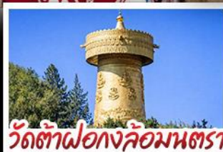
วัดต้าฝอ กงล้อมณฑล