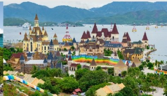
สวนสนุกวันเดอร์ส

*ทางบริษัทฯ ขอสงวนสิทธิ์ในการสลับโปรแกรมทัวร์ตามความเหมาะสมขึ้นอยู่กับสถานการณ์หน้างาน โดยคำนึงถึงผลประโยชน์ของลูกค้าเป็นสำคัญ