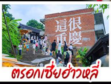
ตรอกซี้ยฮ่าวหลี่