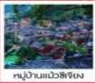
หมู่บ้านแม่วชิเจียง