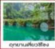
อุทยานเสี่ยวซีโง