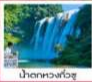
น้ำตกหวงกั๋วซู