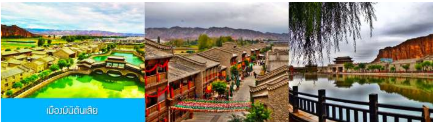
เมืองมินดินสี