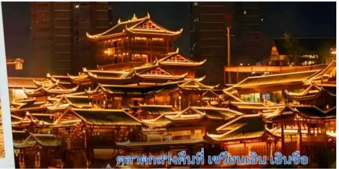
ตลาดกลางคืนที่ เซวียนเอิน เอ็นซือ