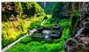
อุทยานแห่งชาติหลุมฟ้า