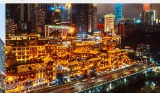
หงหยาดัง(ชมไฟยามค่ำคืน)

*ทางบริษัทฯ ขอสงวนสิทธิ์ในการสลับโปรแกรมทัวร์ตามความเหมาะสมขึ้นอยู่กับสถานการณ์หน้างาน โดยคำนึงถึงผลประโยชน์ของลูกค้าเป็นสำคัญ