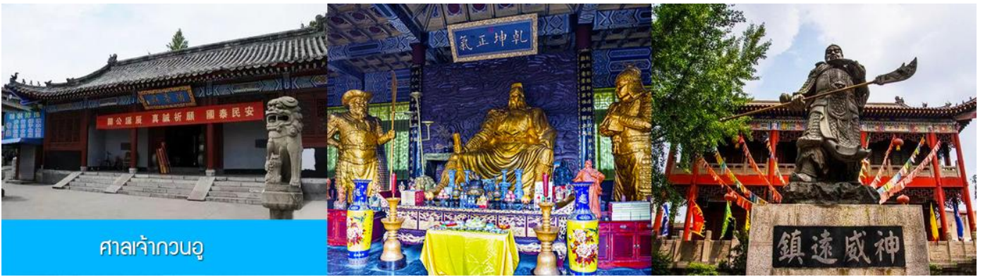
ศาลเจ้ากวนอู