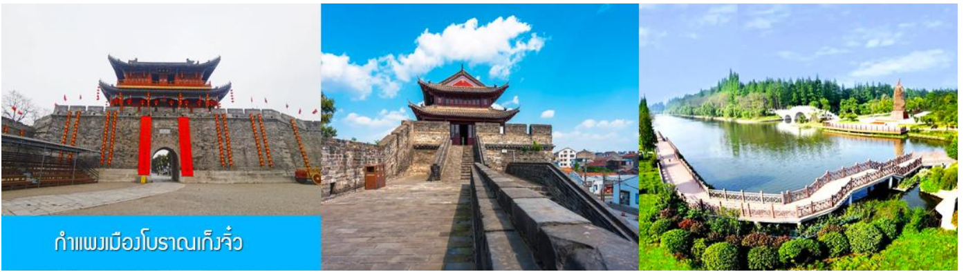
กำแพงเมืองโบราณเกิ่งจิว