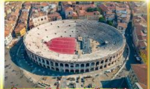
โรงละครโรมันกลางจัวงโรมอ