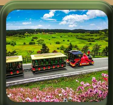
“ อุทยานเขานางฟ้า ”