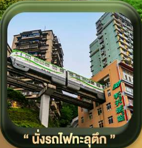
“ นิ่งรดไฟทะลุตึก ”

บินตรงลงจงซิ่ง • อุ้หลง หลุมฟ้าสะพานสวรรค์ • ระเบิดยงแก้ว • อุทยานเขานางฟ้า หงหยาดัง • นิ่งรดไฟทะลุตึก • ศาลาประชาคม (ด้านนอก) • หลงหมินฮ่าว มรดกโลกผาหินแกะสลักต้าจู้ • วัดหลิวอัน • ตึกตะเกียบ • ถนนคนเดินเจียฟางเป่ย์