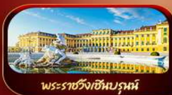
พระราชวังเซินบรูน์