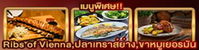
Ribs of Vienna, ปลาเทราสย่าง, ฆาตกรรมเยอรมัน

Zugspitze Munich Salzburg Hallstatt Bratislava