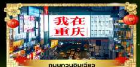
ถนนทวงฉิมเฉียว