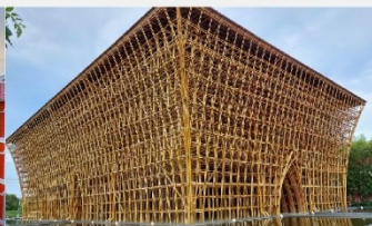
บ้านไม้ไฟ