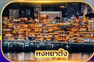
หงหยาดิง