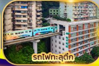
รถไฟทะลุตึก