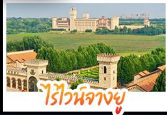
ไรไวน์ฟางยู