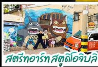
สตรีทอาร์ต สตูดิโอจิบลิ