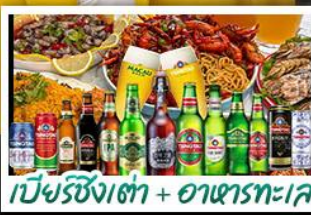
เบียร์ชิงเต่า + อาหารทะเล