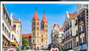
โบสถ์เซนต์ไมเคิล