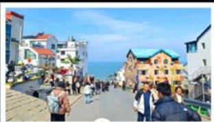
ถนนคอปเพิลิงหมายเลข 8

สัมผัสความยิ่งใหญ่ของ 4 เมืองสำคัญ ชิงเต่า - เยียนโก - เฟิงไห่ - เว่ยไห่ ปาต้ากวน - โบสถ์คาทอลิก - ตึกเก่าริมหา