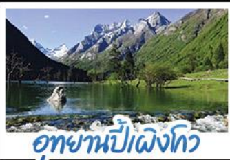
อุทยานปักธงโกว

ภูเขาสี่ดรุณี อุทยานจิวจ้ายโกว นั่งรถไฟความเร็วสูง น้ำพุไม่ไผ่ตักSKP อุทยานปักธงโกว วัดต้าฉือ ถนนโบราณชอยกว้างชอยแคบ ช้อปปิ้งถนนไถ่กู่หลี่ + ถนนซุนชี่ลู่