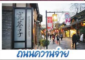
ถนนความจำ