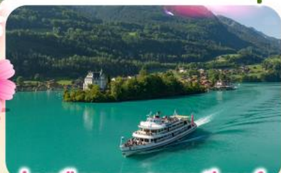
ล่องเรือทะเลสาบเบรียนซ์

พิชิตยอดเขาชุนเนกกา 1 ในเขาที่สวยงามที่สุดเมืองเซอร์แมท