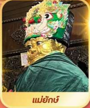
แม่ยักษ์