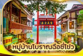
หมู่บ้านโบราณฉือชี่ไป๋