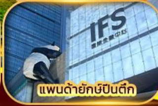
แพนด้ายักษ์ป็นตึก