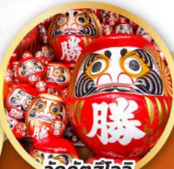
วัดคัตสึโฮจิ (วัดदारุมะ)

ชมความงามของกำแพงหิมะ เส้นทางสายอัลไพน์ทาทยามา (JAPAN ALPS SNOW WALL)