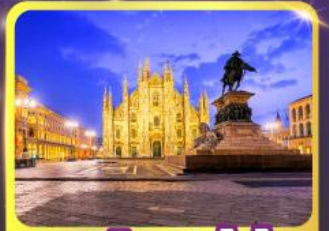
มหาวิหารคูโอโม