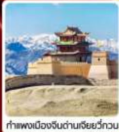
กำแพงเมืองจีนด่านเจียหยี่กวน

• ไซโล่...เส้นทางสายไหม ชมสระบัววังพระจันทร์ ทะเลทรายผิงซาซาน กำแพงเมืองจีนด่านสุดท้าย "เจียหยี่กวน" มรดกโลกภูเขาสายรุ้งจางเย่