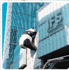
IFS ตึกหมีแพนด้า

● ไอโกล์ นั่งกระเช้าขึ้นชมกุหลาบหิมะวาจู่ ซื้อมั้กถนนชุนซีลู่ แลนด์มาร์คแพนด้ายักษ์เป็นตึก IFS เจียงตู