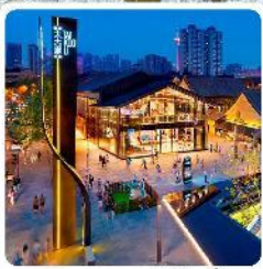
ถนนคนเดินไท่กุ๋หลี