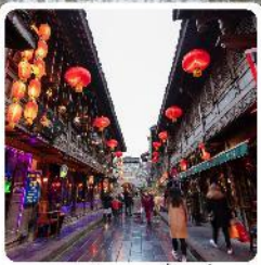
ถนนโบราณจีนหลี