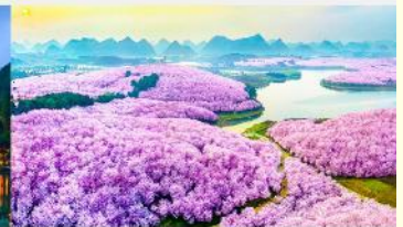
ชากรุง-ผิงป่า

*ทางบริษัทฯ ขอสงวนสิทธิ์ในการสลับโปรแกรมทัวร์ตามความเหมาะสมขึ้นอยู่กับสถานการณ์หน้างาน โดยคำนึงถึงผลประโยชน์ของลูกค้าเป็นสำคัญ