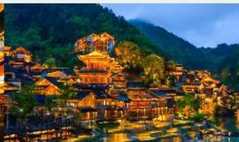
หมู่บ้านโบราณวูเจียงจ้าย