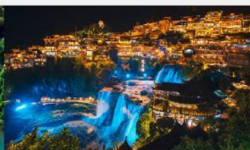
หมู่บ้านโบราณผู้หลงเจิน