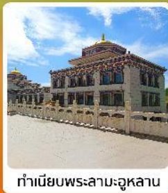
ทำเนียบพระลามะอูหลาน

• ไอโสรท์ เป็นทราseyเสียงชาวมองโกล แหล่งท่องเที่ยวระดับ 5A ของจีน แกรนด์แคนยอนแม่น้ำเหลือง ซี่อูฐท่ามกลางทะเลทราย