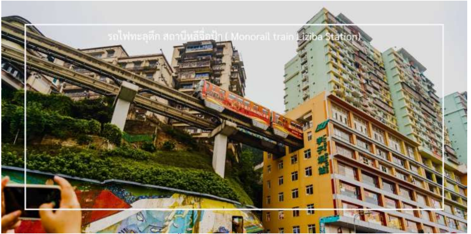
รถไฟทะลุตึก สถานีหลี่จื่อป้า ( Monorail train Liziba Station)

เย็น บริการอาหารเย็น ณ ภัตตาคาร (เมื่อที่ 7) เมนูพิเศษ : สุกี้หม่าล่า