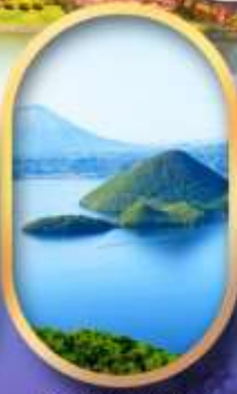
วิวทะเลสาบโทโย