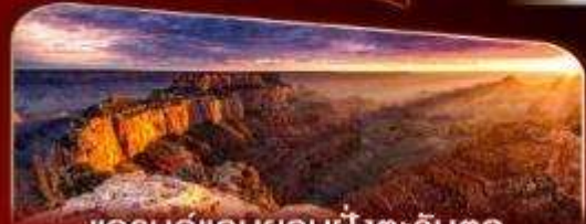
แกรนด์แคนยอนฝั่งตะวันตก

พักลาสเวกัส 2 คืน เต็มอิ่มกับแสงสีแห่งอเมริกา