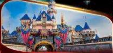
ดิสนีย์แลนด์พาร์ค