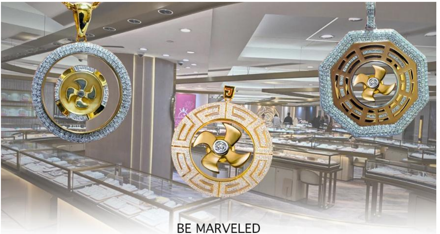
BE MARVELED ศูนย์ฮวงจุ้ย กังหันเศรษฐี

นำท่านชม ศูนย์ฮวงจุ้ย กังหันเศรษฐี ที่ขึ้นชื่อของฮ่องกง ท่านจะได้พบกับงานดีไซน์ที่ได้รับรางวัลยอดเยี่ยม และใช้ในการเสริมดวงเรื่องฮวงจุ้ย โดยการย่อใบพัดของกังหันที่เป็นสัญลักษณ์ของวัตต์แดงหงมิว มาทำเป็นเครื่องประดับ ไม่ว่าจะเป็นจี้, แหวน, กำไล หรือต่างหูเพื่อเป็นเครื่องประดับติดตัว และเสริมดวงชะตา ซึ่งสินค้าทุกชิ้นนี้ มีเอกสาร รับประกันคุณภาพเปลี่ยนหรือ ซ่อม ได้ตลอดอายุการใช้งาน หากเกิดการชำรุดจากสินค้าไม่ใช่อุบัติเหตุ