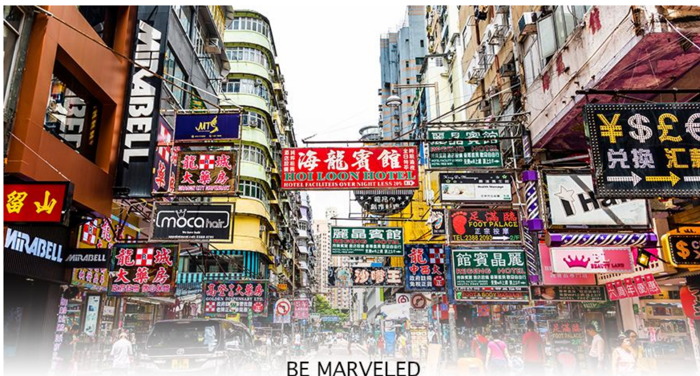
BE MARVELED MONGKOK

นำท่านเดินทาง ผ่านเส้นทางไฮเวย์อันทันสมัยข้ามสะพานแขวนชิงหม่า (TSING MA BRIDGE) ซึ่งเป็นสะพานแขวนสองชั้นที่ยาวที่สุดในโลก โดยมีความยาวทั้งหมด 2.2 กิโลเมตร (1.4 ไมล์) เชื่อมต่อระหว่างฮ่องกงอินเตอร์เนชั่นแนลแอร์พอร์ตกับตัวเมืองฮ่องกง ตัวสะพานชั้นบนจะเป็นทางให้รถยนต์วิ่ง ส่วนชั้นล่างเป็นเส้นทางของเอ็มทีอาร์ (MTR) และแอร์พอร์ตเอ็กเพรสเทรนส์ (AIRPORT EXPRESS TRAINS) สะพานแขวนชิงหม่านี้ ได้ถูกคัดเลือกให้เป็นสัญลักษณ์ของคู่มือทั่วโลกอีกด้วย