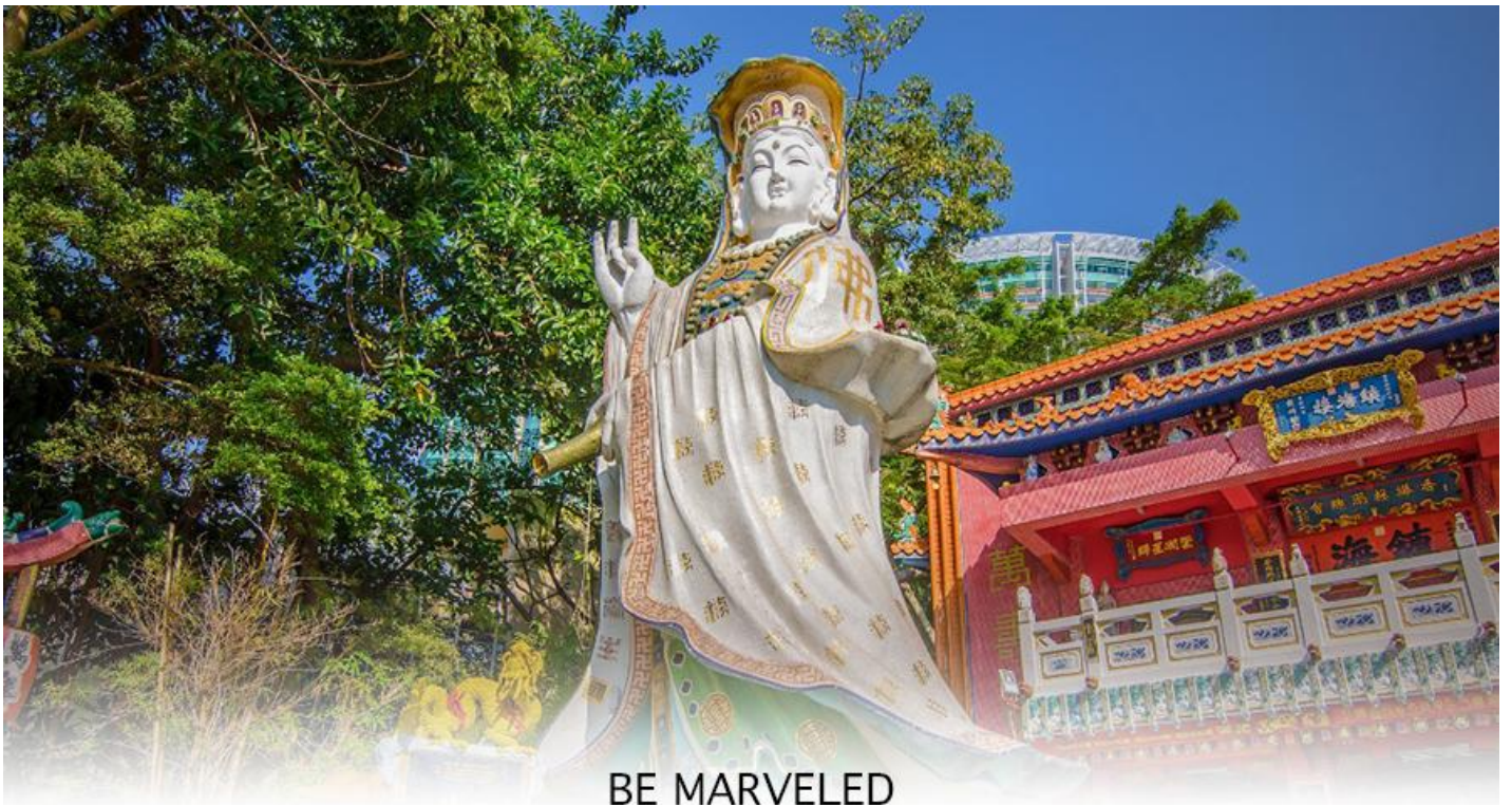
BE MARVELED วัดเจ้าแม่กวนอิมรีพัลส์เบย์

จากนั้นนำท่านเดินทางสู่ ชายหาดรีพัลส์เบย์ (REPULSE BAY) หาดทรายรูปจันทร์เสี้ยวแห่งนี้เป็นหาดที่สวยงามที่สุดแห่งหนึ่งในฮ่องกง และยังใช้เป็นฉากในการถ่ายทำภาพยนตร์หลายเรื่อง ถือเป็นแหล่งท่องเที่ยวยอดนิยมในหมู่ชาวฮ่องกง นักท่องเที่ยวที่นิยมมาสักการะที่ วัดทินฮั่ว อ่าวรีพัลส์เบย์ (TIN HAU TEMPLE REPULSE BAY) ซึ่งตั้งอยู่ริมทะเล เป็นสถานที่ท่องเที่ยวที่สำคัญ สร้างขึ้นในปี ค.ศ.1993 มีรูปปั้นของ เจ้าแม่กวนอิม ปางประทานพรตั้งอยู่ ซึ่งคนฮ่องกงและคนจีนให้ความเคารพนับถือมากที่สุด เชื่อว่าเป็นเทพที่มีความศักดิ์มากขอพรเรื่องการเงิน และขอพรขอโชคลาภเพื่อเป็นสิริมงคลและขอพร