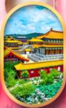
เมืองจำลองสามก๊ก