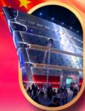
เรือคะหลุยส์