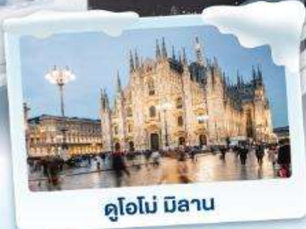
คูโอโม มิลาน