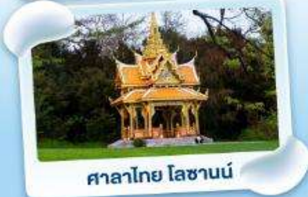
ศาลาไทย ไลซานน์