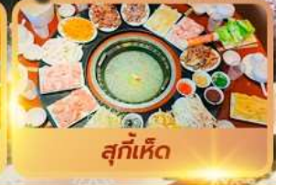
สุกัเห็ด