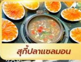
สุกัปลาแซลมอน