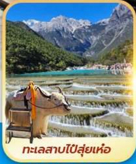
ทะเลสาบโป๋สุ่ยเหอ