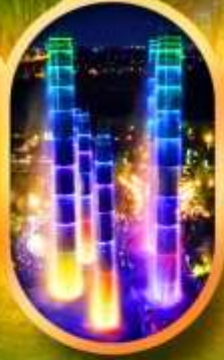
SKP Global Center