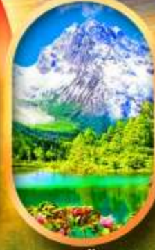
อุทยานปี้ฝิงโกว