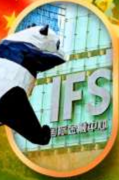
IFS หมีแพนด้าป็นตึก