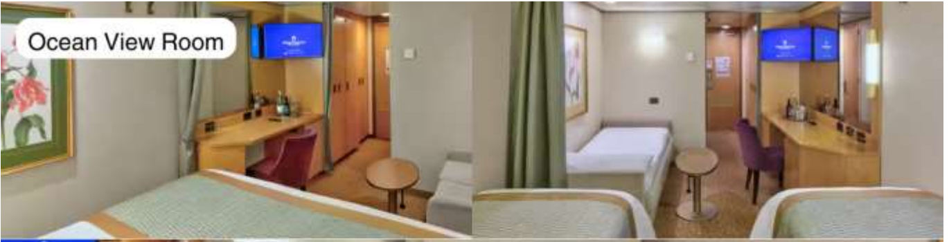
Ocean View Room