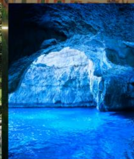
BLUE GROTTO CAPRI