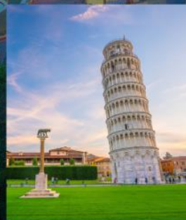
TOWER OF PISA