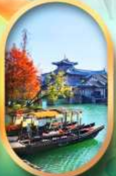
เมืองโบราณผู่หยวน