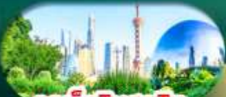
จุดเช็กอินสุดฮิต North Bund Shanghai

เซี่ยงไฮ้ หางโจว ล่องทะเลสาบซีหู ฟรีเดย์