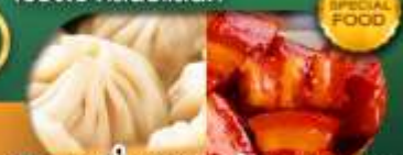
พิเศษ เสี่ยวหลงเป่า หมูแดงพอ เดินทาง ม.ค. - มิ.ย. 69