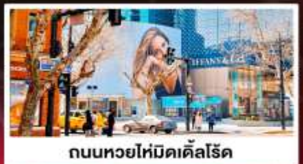
ถนนหยอไห่มีดเคิลโรด