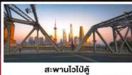
สะพานไวปี้ตู่