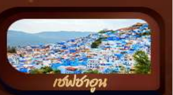
เชฟชาอูน