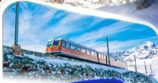
ขึ้นรถไฟฟันเฟืองก่อนนอร์แอด