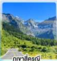
ภูเขาสิ่วรุณี