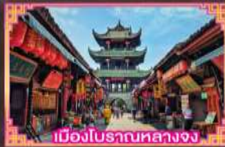
เมืองโบราณหลางจง