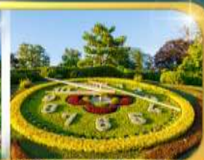
นาฬิกาดอกไม้เมืองเจนีวา

เดินทาง 9 วัน 6 คืน 09-17 ก.พ.69 22-30 มี.ย.69