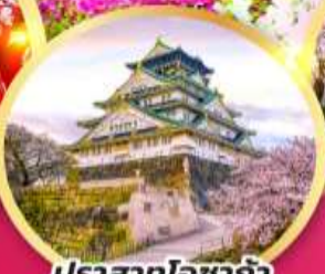
ปราสาทโซาก้า